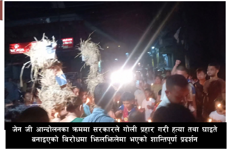
जेन जी आन्दोलनका क्रममा सरकारले गोली प्रहार गरी हत्या तथा घाइते बनाएको विरोधमा भिक्नुभन्नु भएकै शान्तिपूर्ण प्रदर्शन